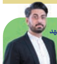
حسین علوی مقدم، رئیس کمیسیون ورزش شورای اسلامی شهر مشهد

مرکز ۱۳۷ بستر ارتباطی بسیار خوبی بین مردم و اعضای شورای اسلامی شهر و مدیران شهری است، چراکه مردم می‌توانند با بهره‌گیری از این فرصت، مشکلات و مسائلشان را مطرح کنند. مقابله با ساخت و سازهای غیرمجاز، مطالبه‌ای بحق و از درخواست‌های پرتکرار مردم به این مرکز است. بنابراین باید به شکل کامل، مانع از ساخت و سازهای غیرمجاز شد.