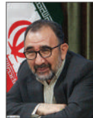
مقوبعلی نظری، استاندار خراسان رضوی

هدف اصلی از تهیه و تدوین طرح‌های تحول، حل مسایل اولویت‌دار استان در قالب پروژه‌هایی است که انجام آن‌ها در مقایسه با سایر پروژه‌ها اثربخشی مضاعفی داشته و اجرای آن‌ها می‌تواند به یک جهش معنادار در توسعه استان منجر شود.