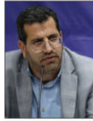
سید هادی طباطبایی معاون سیاسی استانداری خراسان رضوی